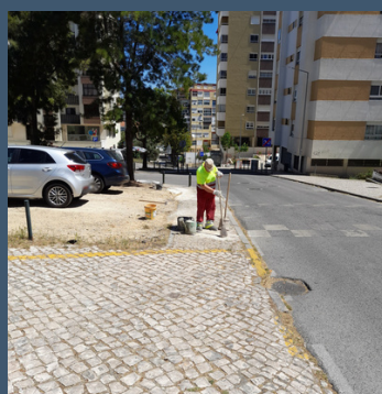
Arranjo de calçada